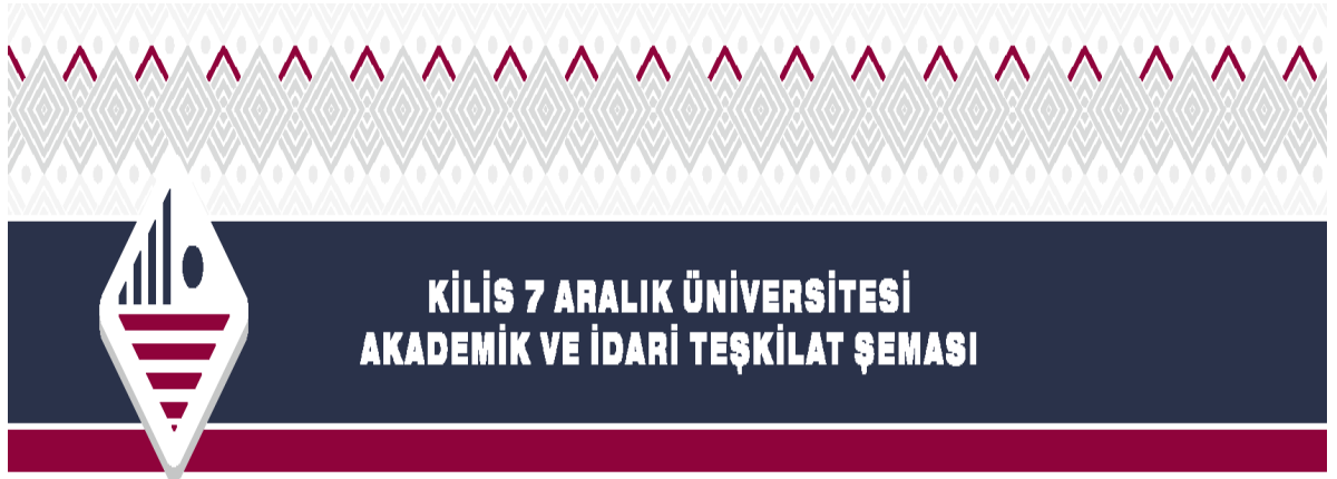
Şekil A.4.1 Kilis 7 Aralık Üniversitesi Akademik ve İdari Teşkilat Şeması